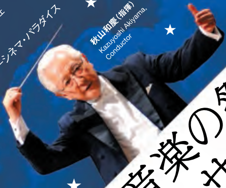
秋山和慶 (指揮) Kazuyoshi Akiyama Conductor